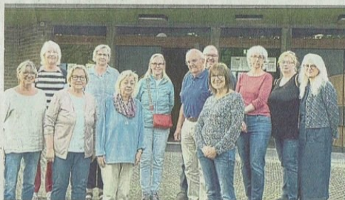
Sie leisten wertvolle Arbeit für schwangere Frauen: Vorstandsmitglieder, Beraterinnen und Mitglieder von „Frauenwürde“ nach der Jahreshauptversammlung.