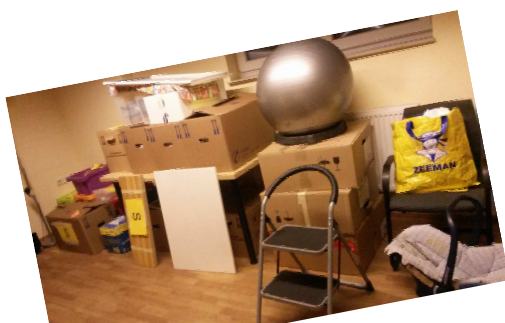
Einpacken, aussortieren, wegwerfen-stressig!