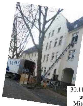
30.11.2016 Umzug – stressfrei auch dank gutgelaunter Mitarbeiter der Fa. Gombert